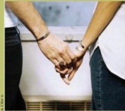
A. C. E. B. ©

William artisan bijoutier, 30, rue Paradis, Marseille 1er. Tél. : 06 20 26 74 93. www.myjewelerisw.com